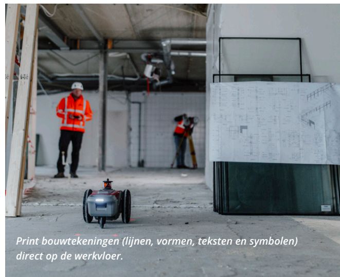
Print bouwtekeningen (lijnen, vormen, teksten en symbolen) direct op de werkvloer.