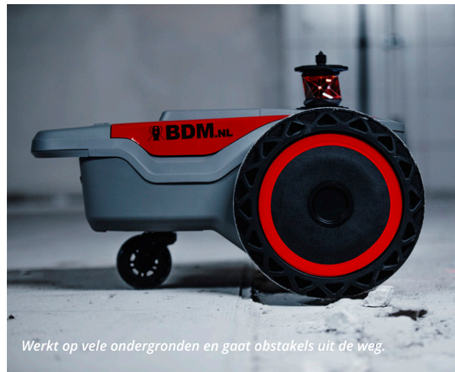
Werkt op vele ondergronden en gaat obstakels uit de weg.