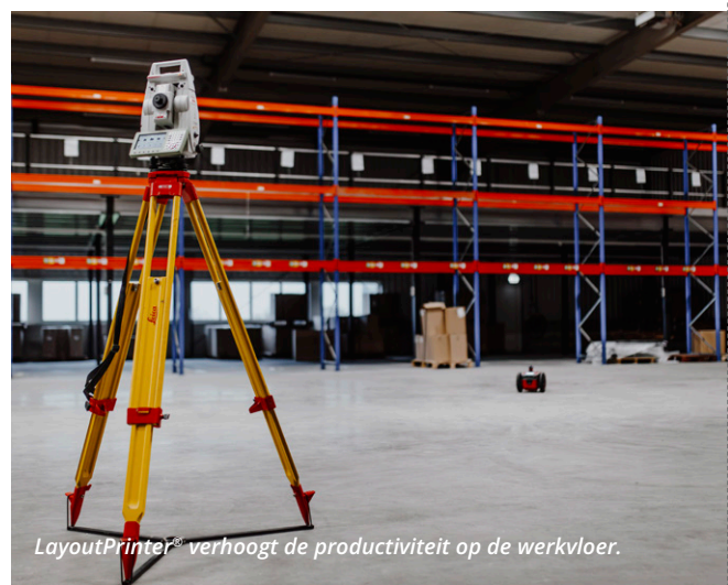
LayoutPrinter® verhoogt de productiviteit op de werkvloer.