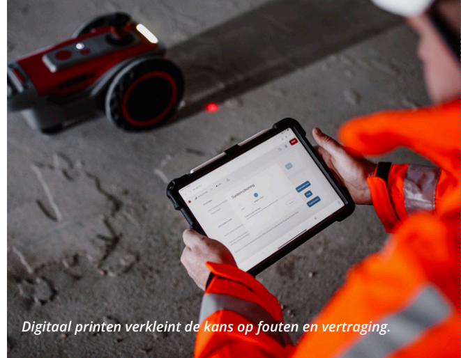
Digitaal printen verkleint de kans op fouten en vertraging.

Zet in 1 werkgang de wanden, het installatiewerk en bijvoorbeeld boorpunten uit voor betrokken (onder)aannemers.