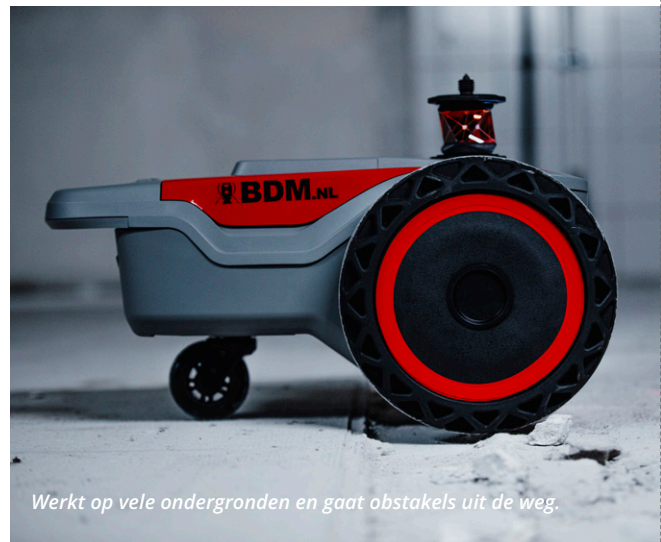
Werkt op vele ondergronden en gaat obstakels uit de weg.